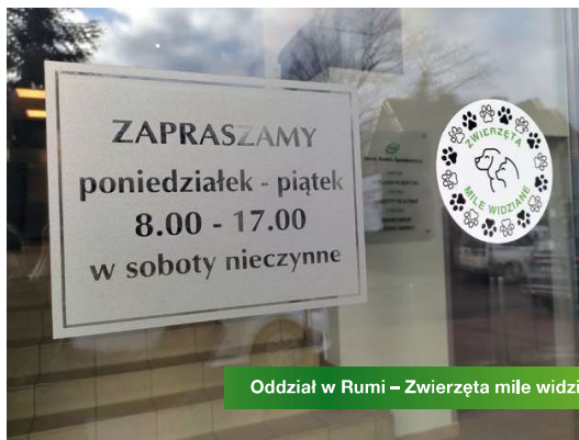
Oddział w Rumi – Zwierzęta mile widziane