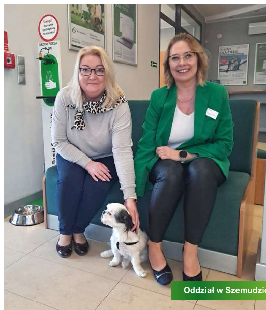
Oddział w Szemudzie

D la wielu z nas zwierzęta są towarzyszami życia codziennego. Postrzegamy je jako naszych pupili, przyjaciół, często nawet rodzinę. Chcemy spędzać z nimi jak najwięcej czasu. Niejednokrotnie jednak zdarza się, że otoczenie, w którym żyjemy nie podziela naszego entuzjazmu, a zwierzęta są nieakceptowalne w większości miejsc. Idąc na spacer z psem zastanawiamy się, czy możemy wstąpić z nim na kawę do kawiarni za rogiem? Albo wejść do sklepu kupić bułki na śniadanie? Przecież to tylko kilka minut, pies jest mały, nikomu nie wadzi. Na szczęście, jest coraz więcej miejsc przyjaznych zwierzętom i dzięki temu możemy odwiedzać restauracje, kawiarnie, czy centra handlowe wraz ze swoimi pupilami, a widok psa,