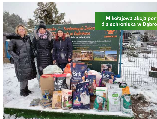
Mikołajowa akcja pomocy dla schroniska w Dąbrowce