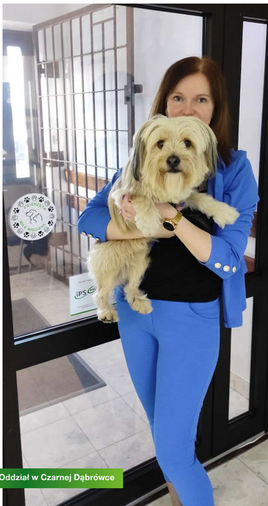
Oddział w Czarnej Dąbrowce