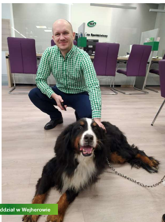
Oddział w Wejherowie

czy kota w tych miejscach już tak nie dziwi. Nieraz jednak nie mamy pewności, czy do danego lokalu możemy wejść ze zwierzęciem, czy też konieczne jest pozostawienie go na zewnątrz. A co z bankami? Banki również są w naszym najbliższym otoczeniu. Przechodzimy obok nich każdego dnia. A gdyby tak połączyć przyjemne z pożytecznym i podczas spaceru z psem móc wejść do oddziału z ważną sprawą, bez stresu, że nasz zwierzak musi czekać na nas w domu, bądź, co gorsza, trzeba go przywiązać przed wejściem na dworzec? Czy banki mogą być przyjazne zwierzętom? Jak najbardziej! Udowadnia to Zjednoczony Bank Rumia Spółdzielczy, który wraz ze swoimi oddziałami i filiami oficjalnie stał się instytucją, w której zwierzęta są mile widziane.