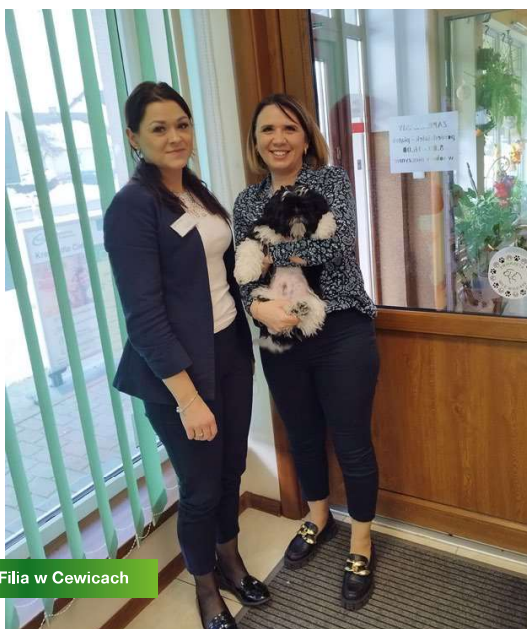
Filia w Cewicach